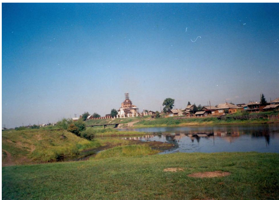
Церковь Пресвятой Троицы (2009), г. Зима.

Несмотря на то, что Свято-Троицкая церковь признана архитектурным наследием, до сих пор должного финансирования храма нет. Помощь поступает в основном от прихожан, поэтому и восстановительные работы длятся уже 20 лет. С большим трудом, но всё же удалось восстановить колокольню, купол. В прошлом году на храме появился крест.