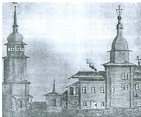
Деревянная Троицкая церковь (1777), г. Зима.

царствование Екатерины II. Первым в Зиме освятили храм Пресвятой Троицы. Место для него выбрали самое наилучшее: на высоком берегу, в месте слияния рек Ока и Мура. Вначале церковь была срублена из добротного сибирского дерева. Архитектура церкви с ярусным храмом типа широкий восьмерик на четверике кажется типичной для того периода времени. Длина храма составляла 8, ширина – 3 и трапезной – 4 сажень.