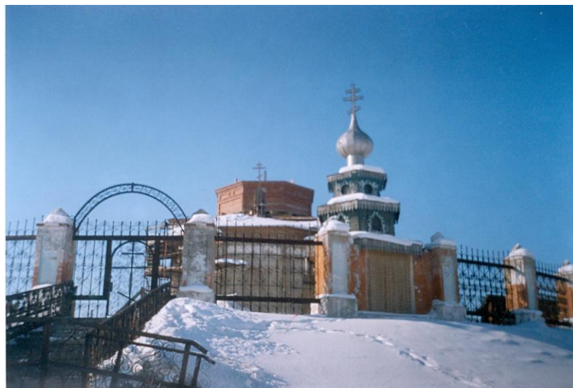
Церковь Пресвятой Троицы (2008), г. Зима

Об одном удивительном памятнике церковного зодчества – о Троицкой церкви – я хочу рассказать поподробнее.