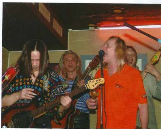
На фото: Uriah Heep и "Аттракцион Воронова" пабе "Ливерпуль"