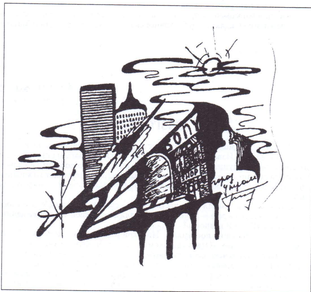
Дмитрий Тимошкин. «Город утром»