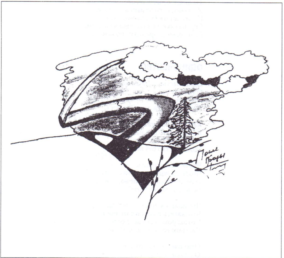
Дмитрий Тимошкин. «После грозы»