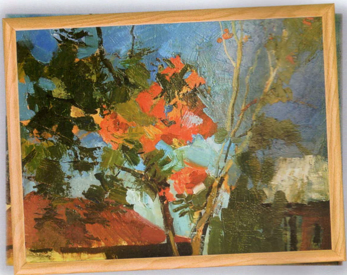
А. Верхозина. "Рябиновое пламя"