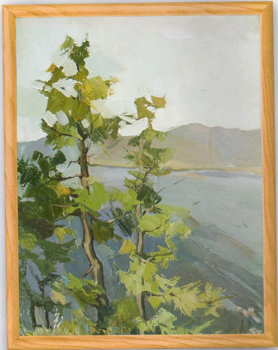
А. Верхозина. "Байкальский ветер"