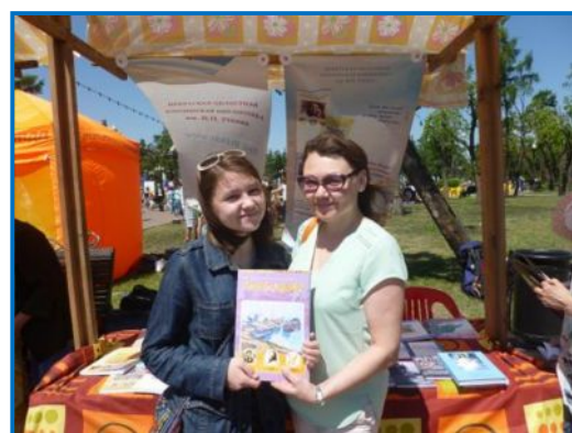
Гостям из Ангарска «Первоцвет» понравился!

Наибольший интерес к «Первоцвету» проявила учащаяся молодежь, причем не только иркутская. Гости из Ангарска, внимательно просмотрев большинство выставленных выпусков, высоко оценили авторов рубрики «Галерея». Многие считают, что художники «Первоцвета» являются яркими представителями иркутской художественной школы во всем ее многообразии.