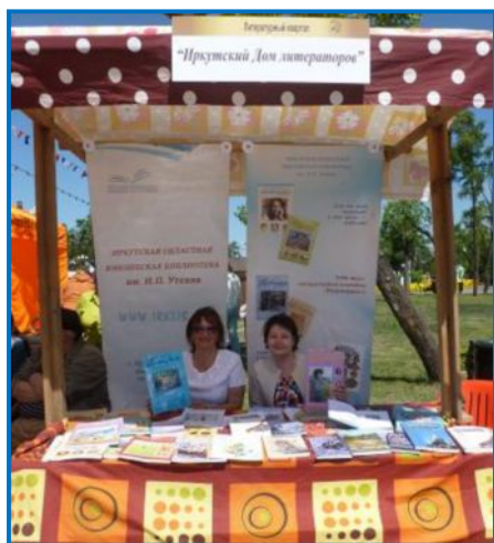
«Первоцвет» ждет своих читателей.

Публичную акцию иркутских библиотек и издающих организаций, ставшую традиционной для празднования Дня города в Иркутске, с легкой руки журналистов стали называть творческой площадкой читального зала под открытым небом. На мероприятии в единое культурное событие объединены выступления иркутских писателей, творческих коллективов, исполнителей авторской песни и любителей поэзии.