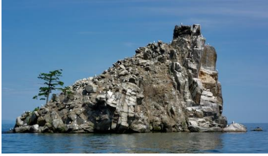
Бакланий камень ,