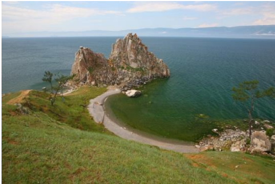
скала Шаманка .

2. Назовите максимальную глубину Байкала (в метрах) .