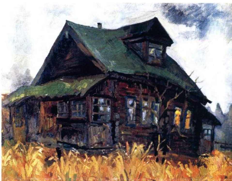
Осинцев С.В. «Старый дом», х./м. 53х42, 1995 г.