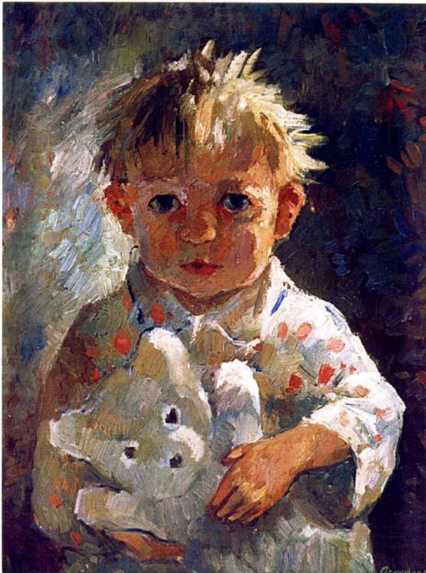
Осинцев С.В. «Портрет дочери», х./м. 60x45, 1995 г.