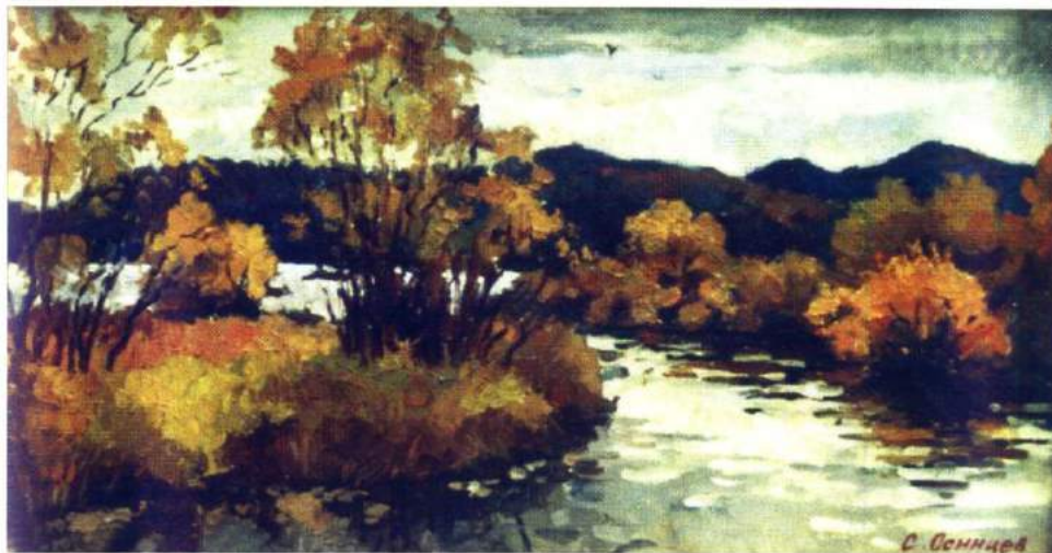
Осинцев С.В. «Осень», х./м. 34х64, 1999 г.