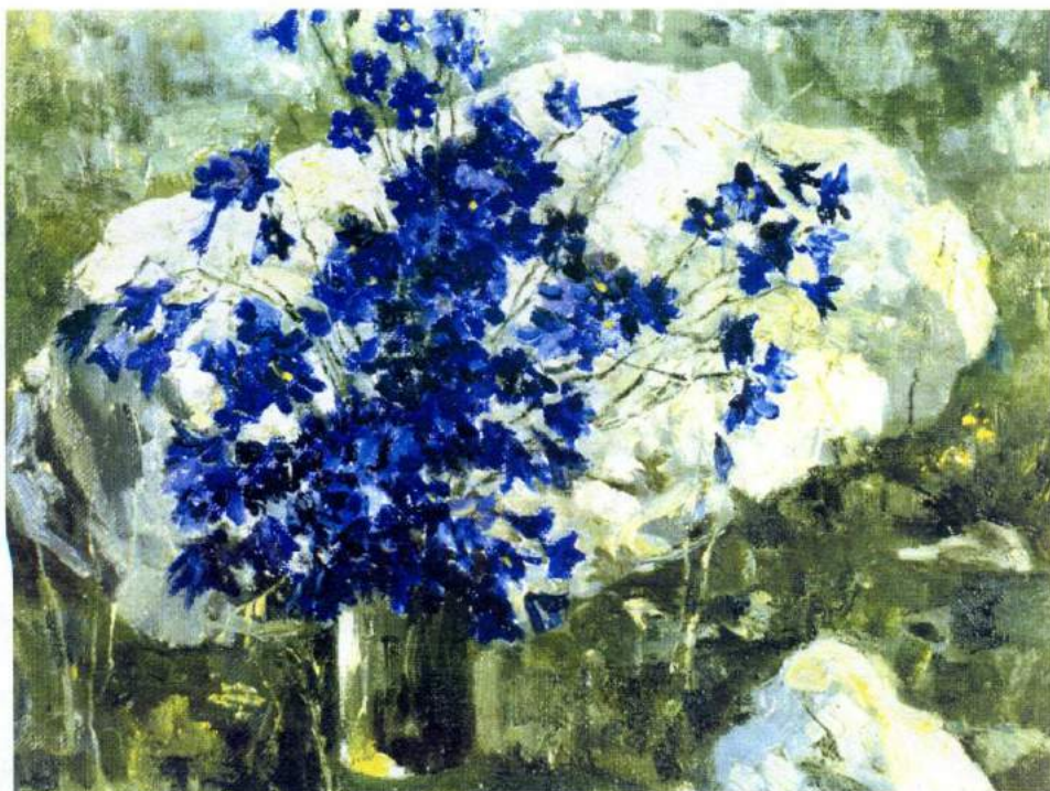
Наталья Сысоева "Байкальские цветы"