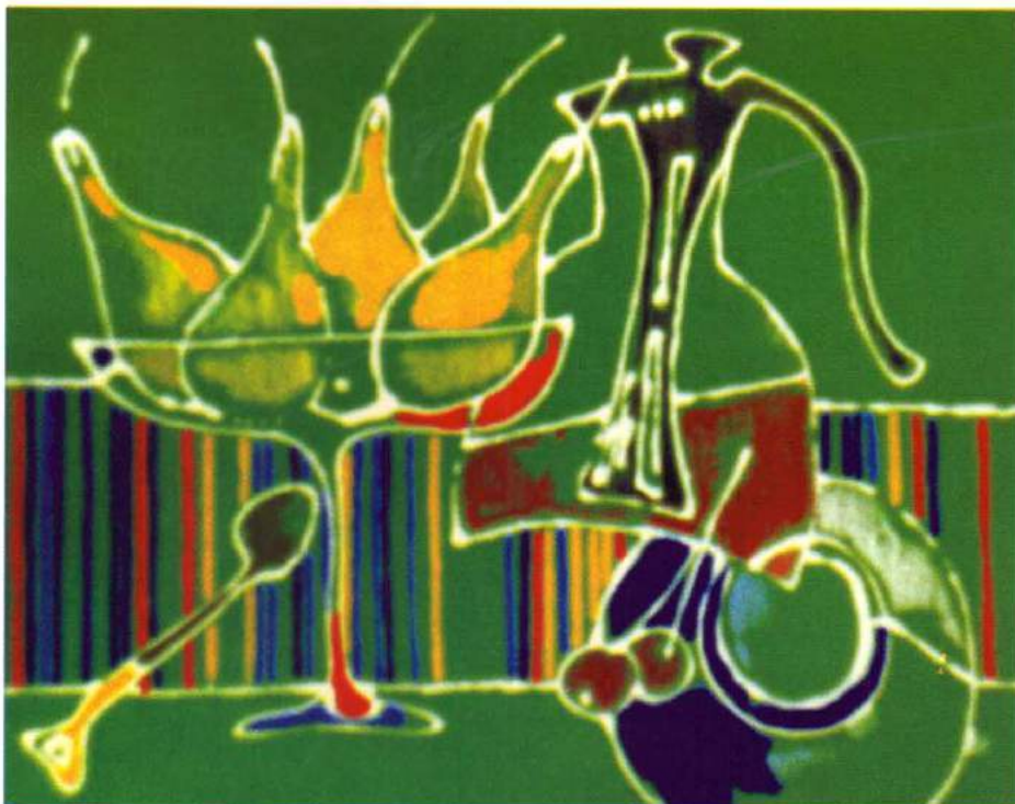
Наталья Довнич. «Натюрморт с грушами»