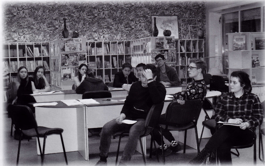
На занятии по стилям языка

Первым этапом проекта стал курс «PROновости – PRO книгу».