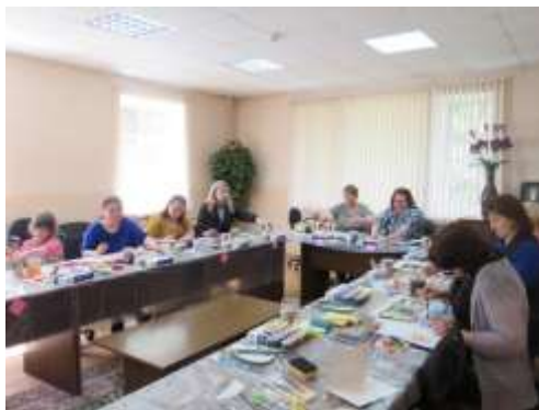
Рисунок 3. Арт-терапия. Родитель-волонтер обучает специалистов, родителей, детей

Инновации: Родители, воспитывающие детей-инвалидов, детей с ограниченными возможностями здоровья, изготавливают из природного материала музыкальный инструмент и используют его в домашних условиях на практике для снятия эмоционального напряжения и решения психологических проблем.