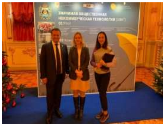
Рисунок 12. Государственный совет по социальной политике Российской Федерации