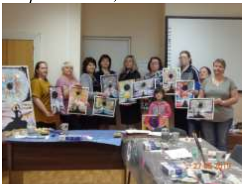
Рисунок 4. Арт-терапия. Работа с чувством страха – волонтеры, родители, дети, специалисты