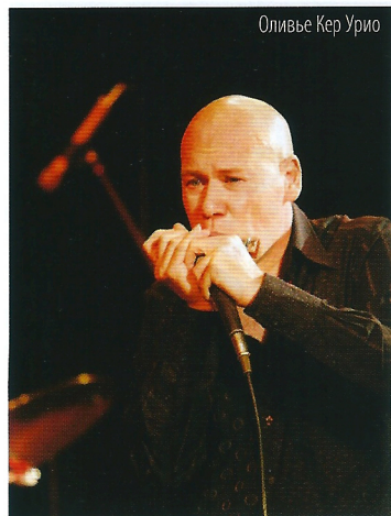
Оливье Кер Урио

И в этом нет никакого преувеличения. На сцене Иркутского Музыкального французский гость с удивительным шармом, изобретательностью и блеском демонстрировал вedomые и, главное, доселе неведомые большинству собравшихся возможности любимого инструмента германских оккупантов из советских фильмов про войну. Что важно, в этой демонстрации не было и малейшего намека на околицерково-триокачество, в которое порой впадают даже большие мастера. Кер Урио относится, по всей видимости, к тем музыкантам, которые в большей степени любят и несут джаз в себе, нежели себя в джазе. Возможно, поэтому его гармоника была столь богата тембрами и многокрасочна звуковой палитре, непостижимым