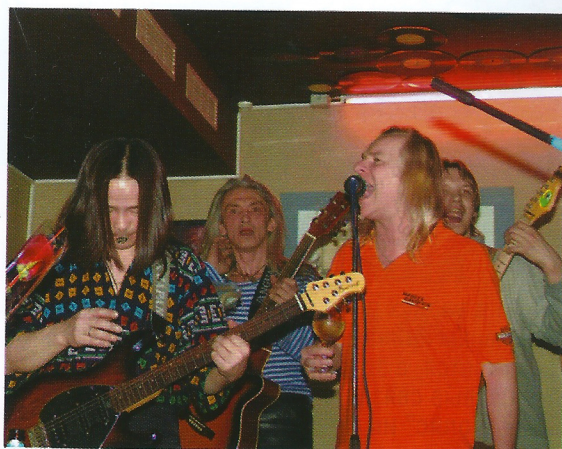
На фото: Uriah Heep и “Аттракцион Воронова” пабе “Ливерпуль”