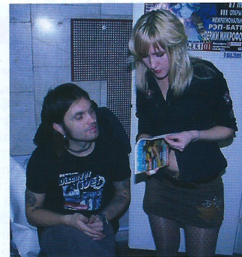
Фео, Зина и «Афиша»

чистки! Фотографируйте мою зубочистку. О творчестве поговорить? Да ну! Вы что!