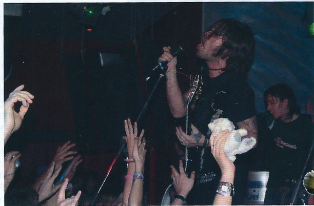
Концерт в «Объекте 01»

■ Мои «телячьи восторги» относительно группы «Психея» оказались не по душе нашему главному редактору, и мой анонс их концерта в «Объекте 01», опубликованный в прошлом номере «Афиши», вызвал у него большие сомнения и чуть было не вылетел из номера... Именно поэтому 27 октября, собираясь на тот самый концерт, я была настроена очень серьезно и даже в некоторой степени скептически.