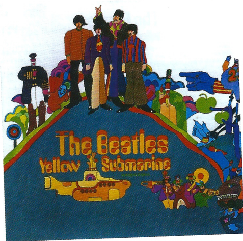
Обложка знаменитого альбома. Автор — в подводной лодке

Забавно, что через несколько лет, когда я созрел для того, чтобы всерьёз заняться "винилом", первой моей "фирменной пластинкой" оказалась... та же самая "Желтая Подлодка"! Хотелось бы красиво приврать насчёт того, что и эра CD, и эпоха DVD по сложившейся судьбоносной традиции конечно же начинались для меня тем же битловским релизом, но не буду на этот раз. На самом деле первый "компакт" в аудио-собрании вашего покорного слуги — "Concerto Grosso №1" Альфреда Шнитке в превосходном исполнении Гидона Кремера и Ансамбля солистов Московской филармонии п/у Юрия Башмета, подаренный на исходе перестройки опять же другом, братом и товарищем по совместному прослушиванию музыки в часы редких встреч, поскольку жили мы в разных городах. "Но у меня нет CD-проигрывателя, и вряд ли будет в обозримом будущем — это неподъёмно и нереально", — совершенно искренне расстроился я, принимая ценный, но бесполезный подарок. "Не переживай, — ответственвал даритель, — и помни мое слово: не пройдет и го-