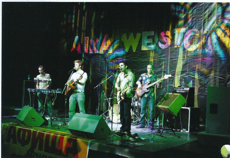
Неожиданный баннер "Байкалвесткома" смотрелся вполне по-калифорнийски