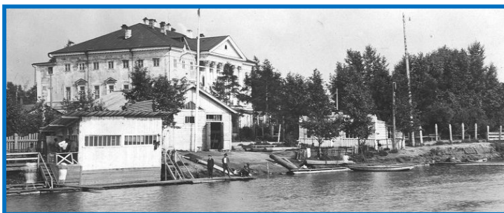
Берег Ангары у Белого дома начало XX века.

Отдельный рассказ был посвящен месту сбора на набережной Ангары. Напротив Белого дома, где ранее располагалась резиденция генерал-губернаторов, а сейчас находится научная библиотека Иркутского государственного университета, стояла на приколе барка (речное несамоходное грузовое судно, буксируемое с помощью людской или конной тяги). На этой барке жил поэт-футурист Артур Куле (псевдоним