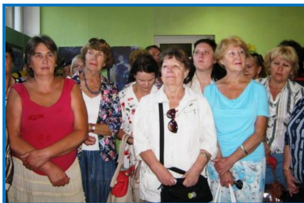
Гостей библиотеки знакомят с историей создания альманаха «Первоцвет».

Гостей пригласили в зал проектов, где работает выставка «Картинная галерея альманаха «Первоцвет». Состоялась презентация альманаха. Большой интерес гостей вызвали просмотр литературы