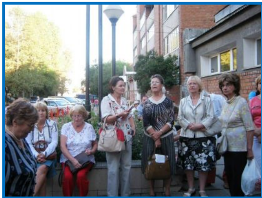
Участники экскурсии на крыльце библиотеки.

По мнению составителя одного из поэтических сборников Иосифа Уткина, поэт «...разделяет с молодежью ее стремления и надежды. И в этом залог его бессмертия, потому что, невзирая на свой тысячелетний возраст, человечество всегда молодо».