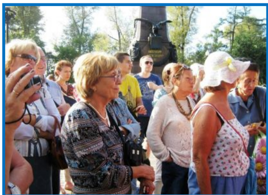
Участники экскурсии у памятника Александру III.